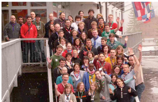
Photo des participants de RoverNet3.0 et Agora

Les membres européens de la branche aînée qui n'ont pas pu participer à RoverNet3.0 sont invités à consulter les résultats et à apporter leur contribution sur RoverNetCom.